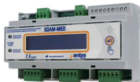
Unità di monitoraggio degli stati di allarme da n°10 ingressi digitali per gas medicali